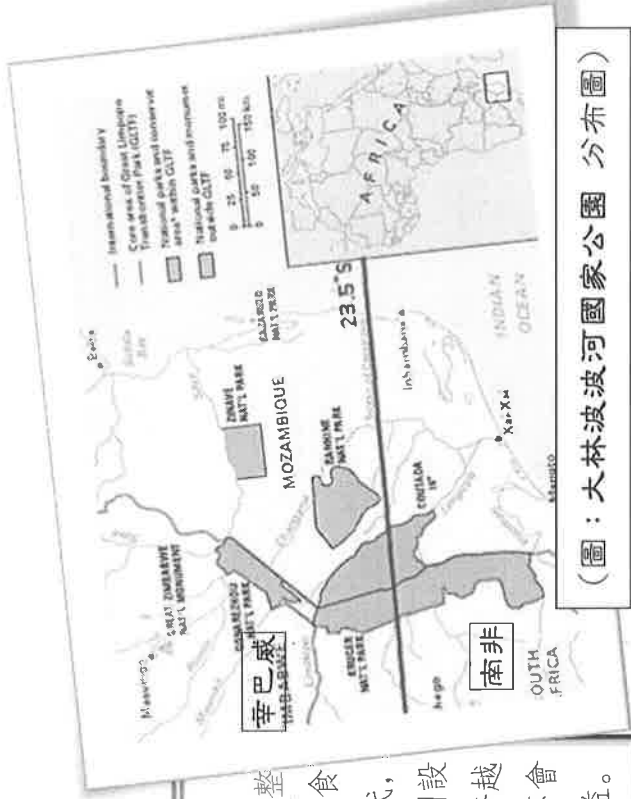
(圖：大林坡波河國家公園 分布圖)

非洲 大林坡坡河跨國公園 是由南非的克魯格國家公園、莫三比克的林坡坡國家公園、以及辛巴威的古納瑞奇胡國家公園整合成的跨國公園（位置如右圖），該公園內草食動物定期遷徙，肉食動物隨草食動物遷徙而移動。遠溯至尚未劃分國界的非洲原始時代，動物的移動與遷徙是沒有界線的，大草原都是牠們的家；如今公園設置雖使三國牧民的牧地受限，但園內動物數量漸增加、牠們可以跨越政治藩籬，蹂躪著古老遷徙路線移動、自由進出任何「國家」而不會因國家主權不同遭獵殺，而各國也得到畜牧業之外的額外經濟利益。